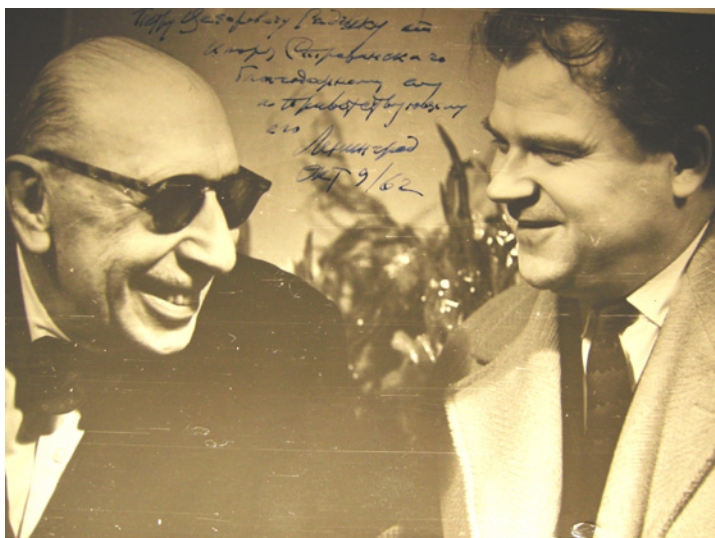
13. И. Ф. Стравинский и Т. Н. Хренников. Фотография с дарственной надписью Стравинского П. Ц. Радчика. 1962 г.