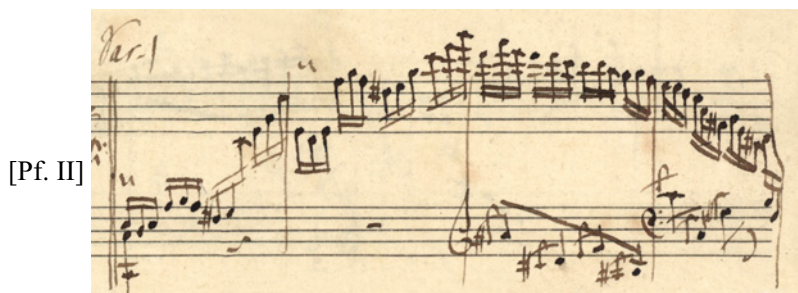
2. И. Мошелес, Ф. Мендельсон. Фантазия и вариации на тему из «Прециозы» Вебера. Вариация 1. НИОР СПбГК. № 4545. Л. 8 (партитура) и 28 (партия фортепиано II). Фрагменты. Автограф Ф. Мендельсона